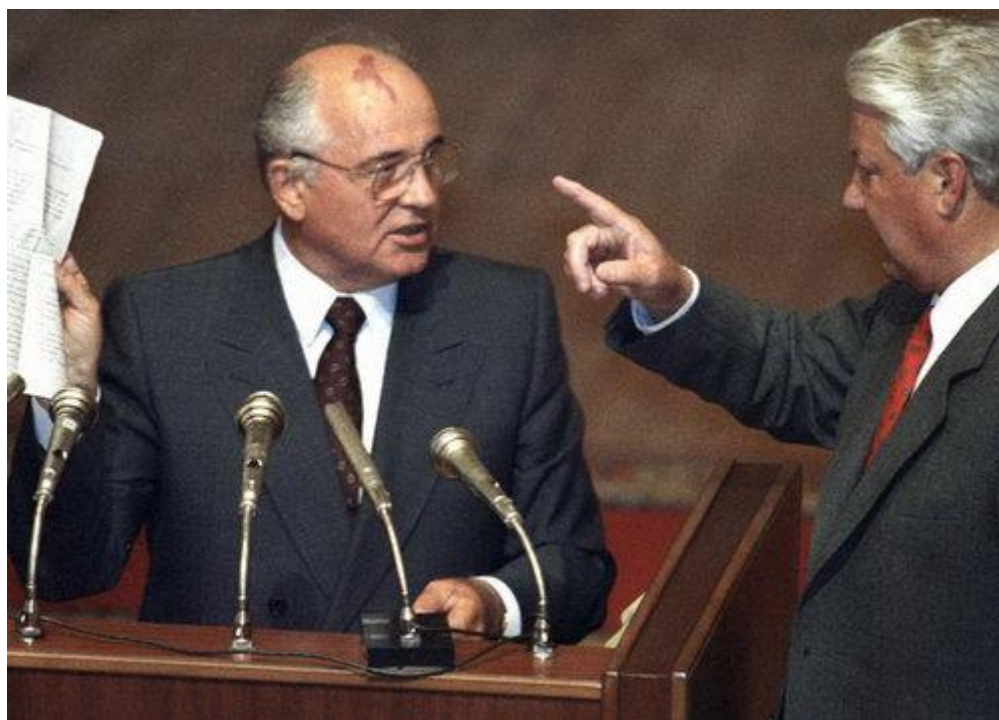
Два президента. Диалог не получается

Горбачев сошел с трибуны растерянным или даже поверженным. Через несколько минут Ельцин пригласил Горбачева в свой кабинет. Это была встреча с глазу на глаз, но Горбачев не мог забыть о ней и через десять лет. «Ну знаете, — говорил экс-президент в одном из интервью в 2001 году, — это как пойманную мышку кот гоняет: намял ей бока, уже с нее течет, а он все не хочет съедать, а хочет поиздеваться. Это он делал. Делал».