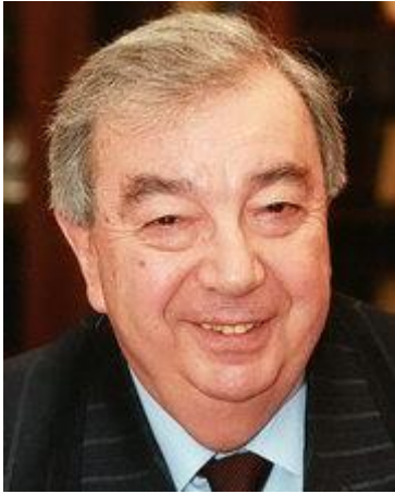
Евгений Примаков, востоковед, разведчик, министр, премьер

Разумеется, интересы Российской Федерации не имели такого глобального масштаба, какой имели интересы Советского Союза. Конституция Российской Федерации отвергает установление в стране какой-либо обязательной государственной идеологии и декларирует идеологическое многообразие. Поэтому служба разведки, как и военная служба, в 90-е годы департизирована и деидеологизирована.