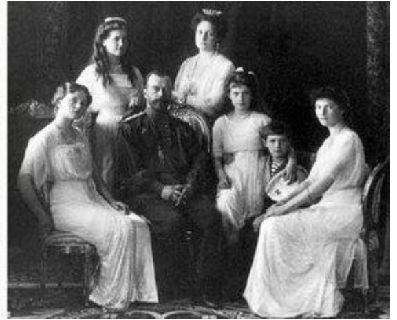
Снос Ипатьевского дома и похороны царской семьи - все было сделано Ельциным