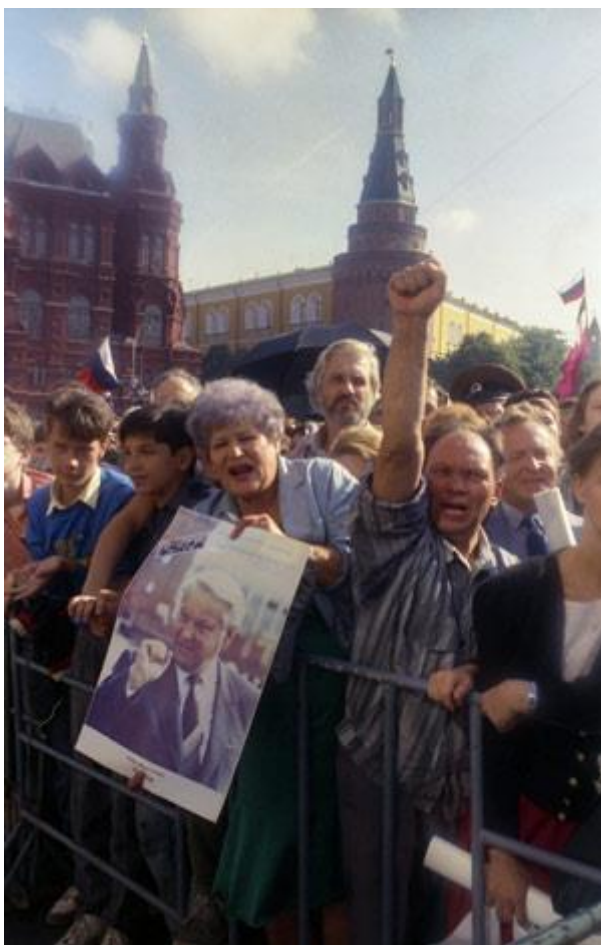
Когда-то Москва любила его