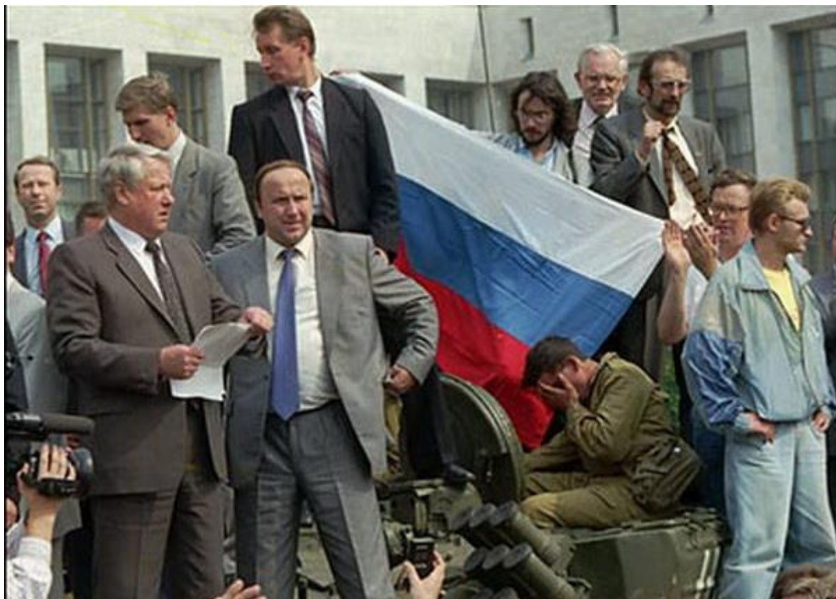
Август, путч, танк

В марте 1993 года все «силовые» министры были вынуждены встать на сторону Съезда народных депутатов. Но теперь они встали на сторону президента. В Белый дом прибыл только Генеральный прокурор В. Степанков. Уже поздно вечером 21 сентября в Белый дом прибыли лидеры наиболее радикальных оппозиционных организаций.