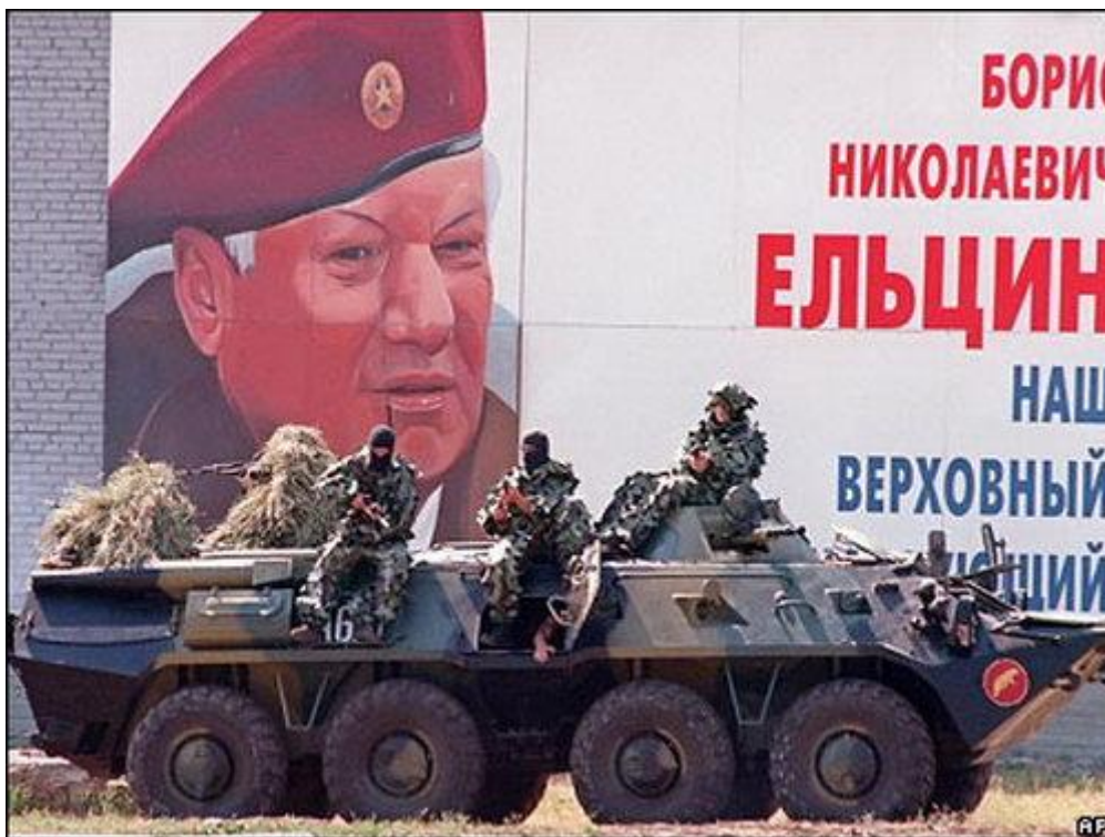
В 1993-м спецназ встал на его сторону