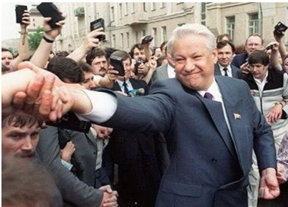
Крепкое рукопожатие, пока что не президентское