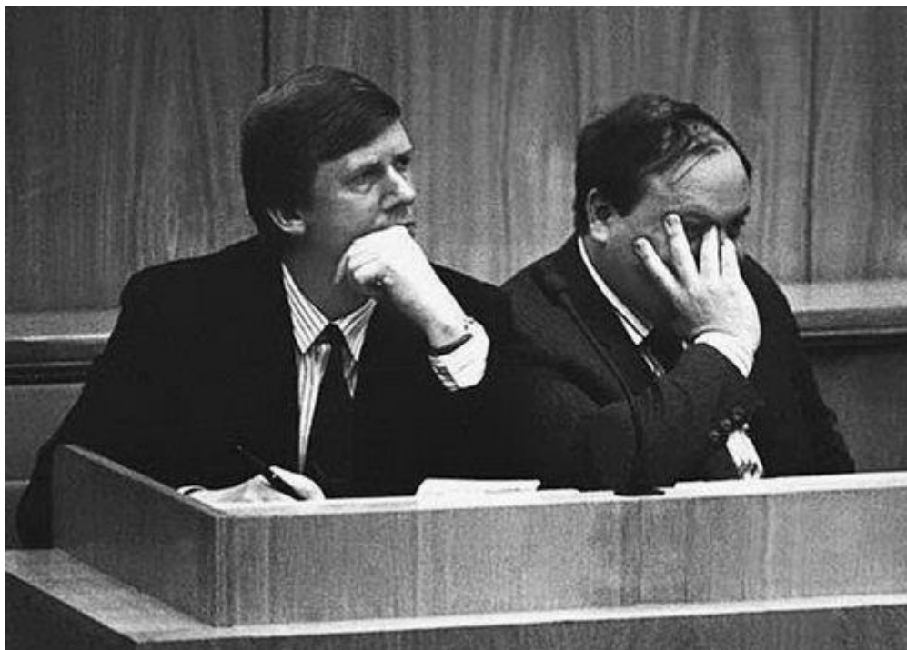
Анатолий Чубайс и Егор Гайдар, непопулярные реформаторы