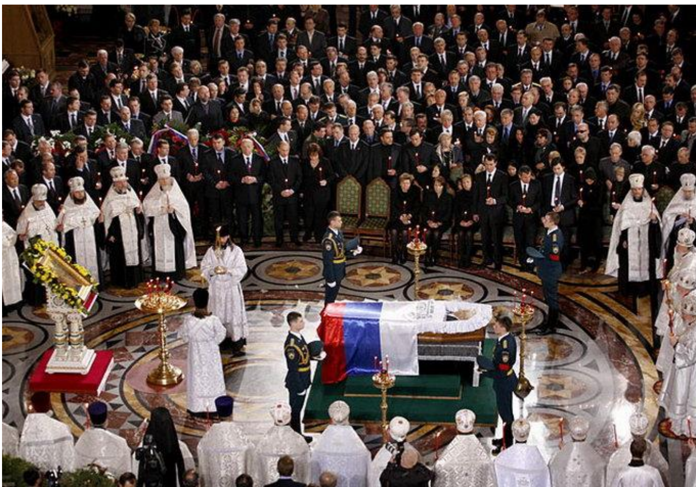
Прощание почти без скорби