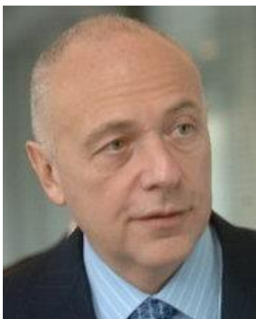
Андрей Козырев, дипломат «с детским лицом»

Определяя основы внешней политики России, Козырев неоднократно заявлял, что будет стремиться сделать Россию не только партнером, но союзником стран Запада, и в особенности США. Это, подчеркивал Козырев, не «инфантильный проамериканизм», а сознательная политика. «Я как был западником и проамериканцем, так им и остаюсь».