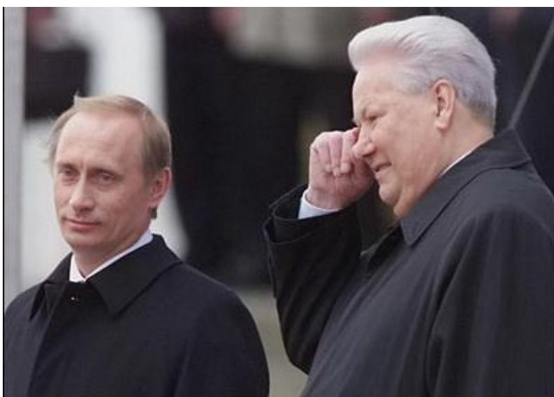
Преемник слушал Ельцина недолго

Популярность Путина продолжала расти. Рост его президентского рейтинга с 2% в августе до 15% в конце сентября оценен социологами как необычный. В конце октября все говорили о «беспрецедентном росте»: рейтинг Путина поднялся до 25%. В конце ноября, когда у Путина было уже 40%, все наблюдатели и политологи говорили, что рейтинг премьера достиг «запредельных высот» и больше уже не может увеличиваться.