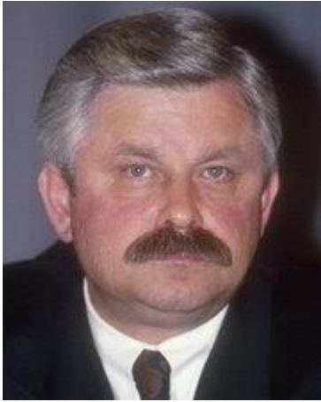
Александр Руцкой, летчик и вице-президент

Руцкой непрерывно звонил в разного рода воинские части, но его распоряжения и приказы никто не хотел выполнять. Армия не спешила выполнять и приказания Ельцина, генералы не хотели воевать с гражданским населением и разгонять Верховный Совет. Министр обороны Павел Грачев был все время на стороне Ельцина, но и он не смог убедить Коллегию Министерства обороны более четко обозначить свою позицию. Настроения среди офицеров отличались сложностью и противоречивостью. Данные социологических опросов, проводимых в 1993 году среди офицеров и военных пенсионеров, свидетельствовали о малой популярности в армии Ельцина. Его рейтинг в августе—сентябре не превышал 30 пунктов, тогда как рейтинг Руцкого достигал 40 пунктов. В военной среде росла популярность Владимира Жириновского (до 12 пунктов) и генерала Александра Лебеда, который командовал 14-й армией в Приднестровье (до 7 пунктов). 1—2% опрошенных называли генерала Альберта Макашова. Неудивительно, что первым решением Коллегии МО стало решение о нейтралитете.