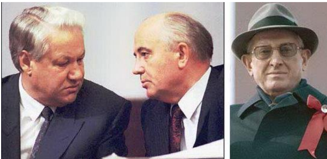
Генсеки - начальники, соратники и противники

Первая беседа Ельцина с Андроповым по телефону состоялась только в 1977 году. Речь шла при этом о судьбе знаменитого Ипатьевского дома в Свердловске. Как известно, в большом доме в центре города, принадлежавшем ранее купцу и инженеру Ипатьеву, находилась в последние недели своей жизни семья и часть прислуги последнего российского императора Николая II. Здесь все они были убиты 17 июля 1918 года.